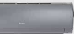
Fairy Silver (S)