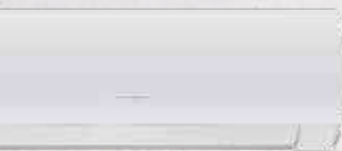
Fairy White (W)