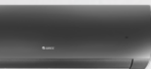
Fairy Dark (D)